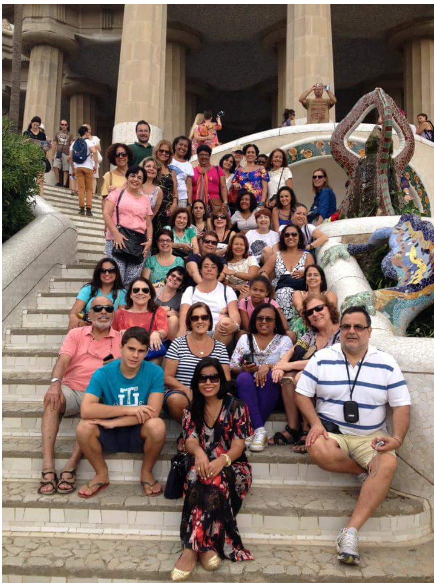
Park Guell, Barcelona

Aguardamos de todos os que participaram dessa bela experiência que nos enviem suas fotos, para que possamos registrar, divulgar e sempre relembrar.